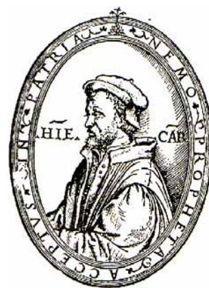
カルダノの肖像画

確率の研究は、400年以上前のルネサンス期のイタリアに起源すると言われている。遡ること12、13世紀の北イタリア、ジェノバ・ピサ・ヴェネチア三港では、十字軍輸送帰りの空船による地中海東方貿易が栄えていた。北イタリアの発展を享受した人々は賭博に親しんだと考えられる。3次方程式の解公式を出版したことで著名なジロラモ・カルダノ（1501 - 1576）もその時代を生きた。彼は、サイコロやカードを用いた賭け事を愛し、一時は医者や大学などに勤めながら、財産や子どもを失うなど劇的な生涯を送ったことでも知られている。