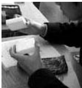
写真6 モデルを 使って考えている