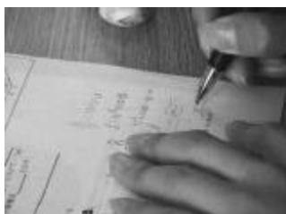
写真8 実際に X^3 + 6X = 20 を解いている

現在との表記の違いによって混乱していた生徒もスライドと立方体のモデルを使い証明を説明したところ大部分の生徒は理解できたようだった。未学習の内容だったためか、理解するのは困難であったようだが、三次方程式が解けた時には感動する生徒もいた。