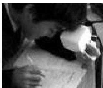
写真5 立方体のモデ ルを使って考えている