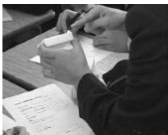
写真7 モデルを 使って説明している