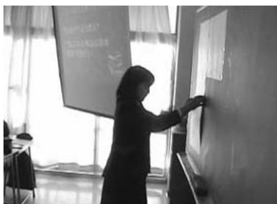
写真3 生徒が前に出て説明し

紙とハサミによって解の公式を求める事は生徒にとって分かりやすかったようだ。生徒に発表させたところ、きちんと理解しているようだった(写真 3)。