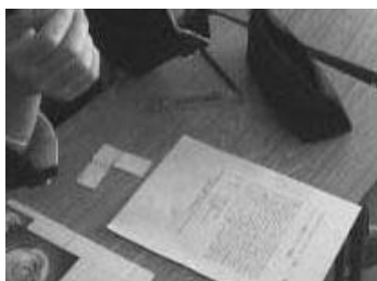
写真2 切り取った図形を並び替えて平方完成している